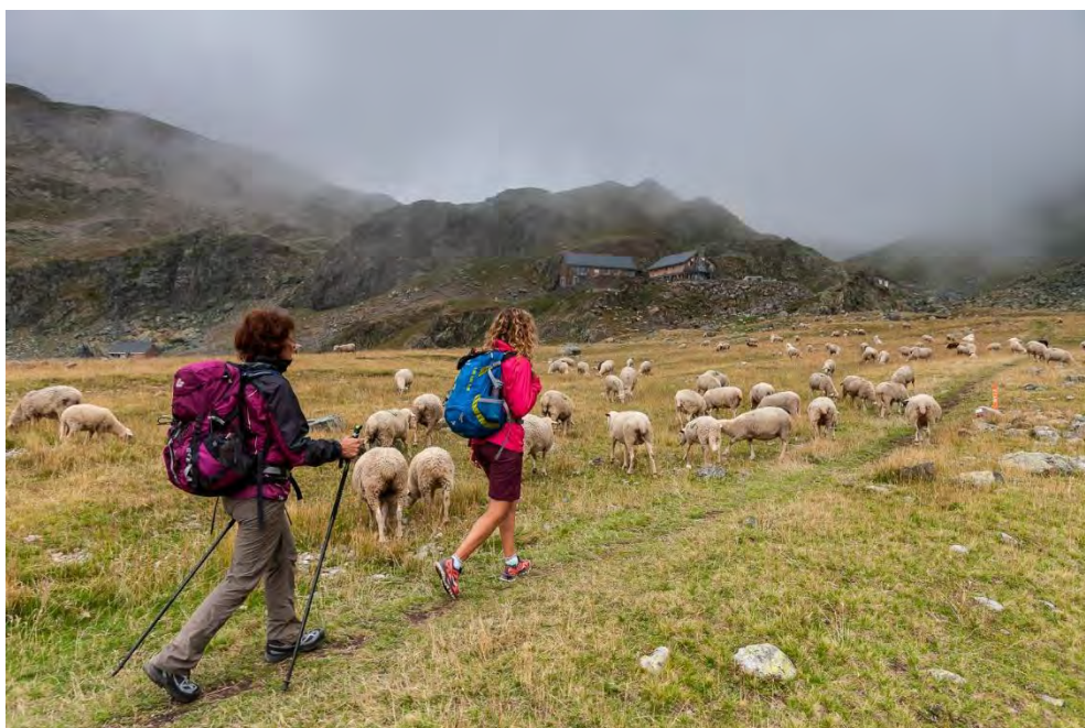
La cohabitation de la randonnée avec le pastoralisme : un enjeu prioritaire pour Espace Belledonne

Espace Valléen est un programme d'actions, initié et soutenu par l'Etat, les Régions AURA et Sud et l'Europe.