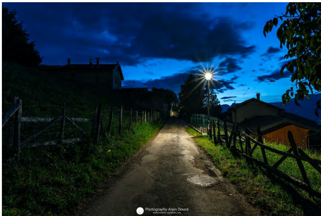
Venon de nuit

Une matinée de travail sur l'éclairage privé a été organisée le 14 mars 2024 dans les locaux de la Métropole de Grenoble et a réuni une vingtaine de participants.