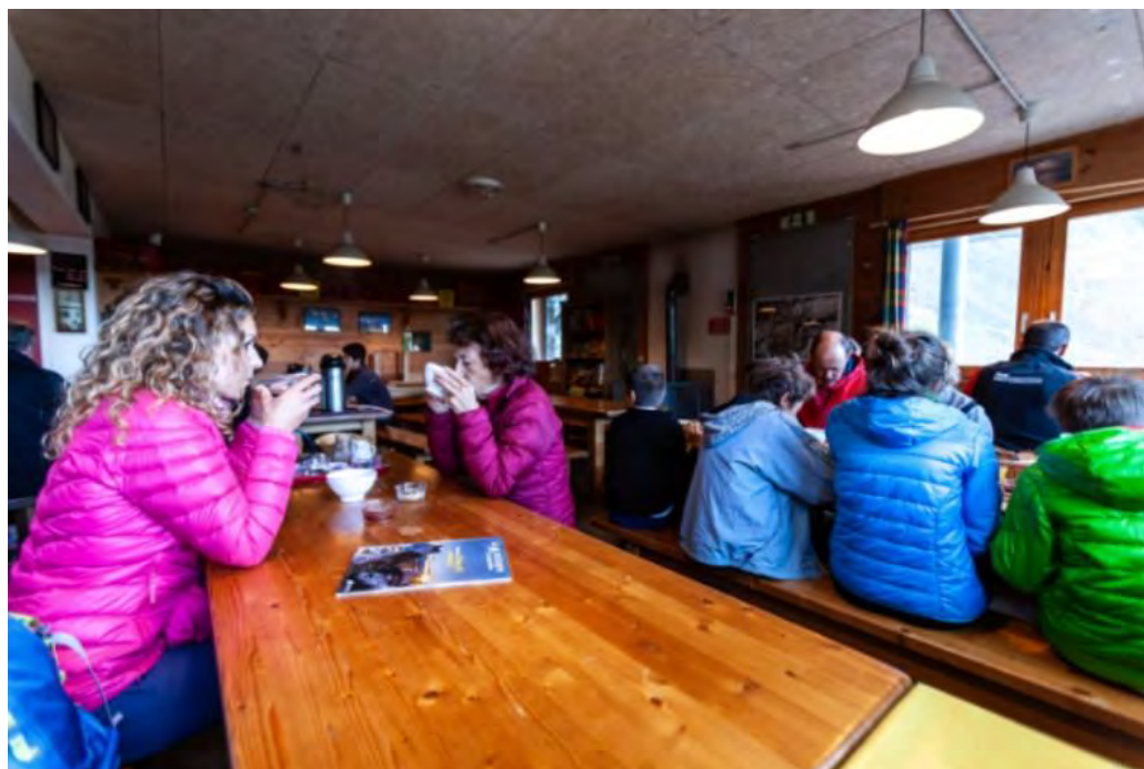
Ambiance dans un refuge de Belledonne