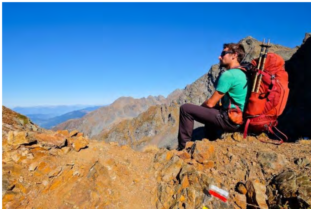
Randonneur sur le GR®738 (marque blanche et rouge) admirant le paysage