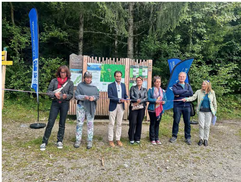
Inauguration des panneaux d'accueil du camp de base de Freydières

L'Espace Belledonne a organisé le 26 septembre 2024, en partenariat avec la communauté de communes Le Grésivaudan, l'inauguration du camp de base de Freydières avec l'installation des panneaux d'accueil.