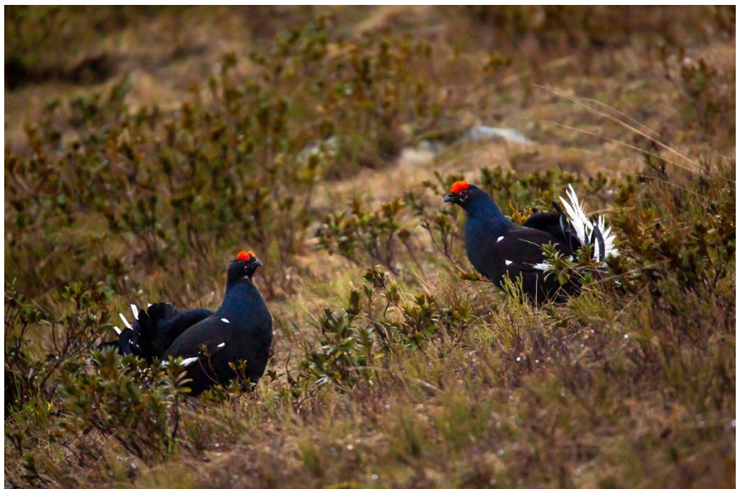
Le Tétras lyre, une espèce à enjeu de Belledonne

Site Natura 2000 Belledonne Sud, construction de la stratégie biodiversité de la communauté de communes Cœur de Savoie, suivi de la stratégie aires protégées pilotée par les DDT de l'Isère et de la Savoie, etc.