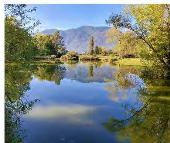
Les aménagements de l'Etang du Plan à Vizille

Le CVB est un programme de la Région Auvergne Rhône Alpes.