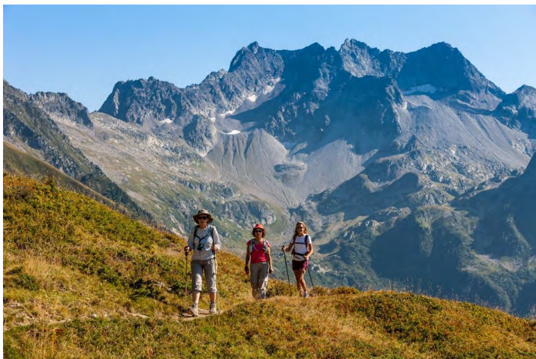
Vers le refuge de la Perrière